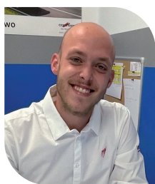
LOISIRS CAMPING-CARS Antoine SCHMITT ||| STAND RAPIDO